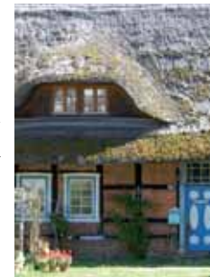
Die Elfenschule in Neuenkirchen.