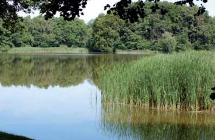
Blick auf den Neuenkirchener See.