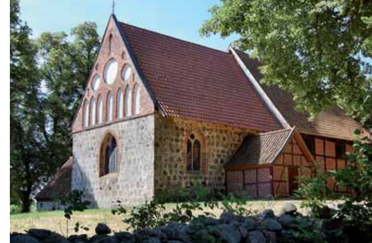
Feldsteinkirche zu Neuenkirchen.

Das Restaurant finden Sie kurz hinter der „Alten Schmiede“ direkt im Neuhoof Schloss. Genießen Sie, mit Blick auf den Park und die kleine Kapelle, Mecklenburger Gerichte aus saisonalen und regionalen Produkten. Geöffnet ist das Restaurant Montag